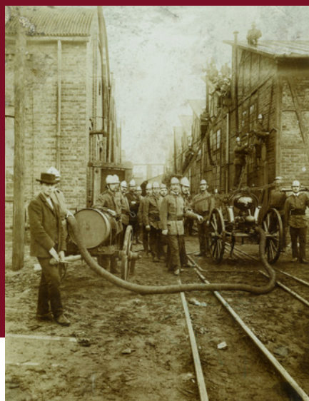
Ćwiczenia pokazowe na terenie Głównych Warsztatów Kolejowych Warszawa-Praga 6.06.1912 r.

W poszczególnych dyrekcjach terenowych PKP działały specjalne referaty pożarnicze zajmujące się całokształtem spraw pożarniczych (organizacją straży pożarnych, wykonywaniem przepisów, podziałem kredytów, zakupem