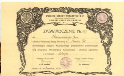
Zaświadczenie z kursu członka Kolejowej Straży Pożarnej w Brześciu nad Bugiem z 2.09.1938 r. wg programu Ministerstwa Komunikacji.