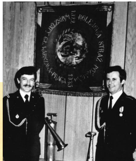
Sztandar Kolejowej Straży Pożarnej Warsztatów Głównych Warszawa-Praga (1922-1935) w Izbie Tradycji Strażackiej ZZSP PKP Siedlce, otwartej 25.05.1984 r.