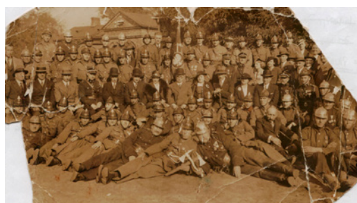
Kolejowa Straż Pożarna Warsztatów Głównych Warszawa-Praga w 1932 r.