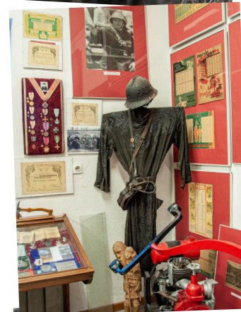
Oblany smołą habit i hełm brata Cherubina podczas akcji gaśniczej w Błoniu w 1974 r.